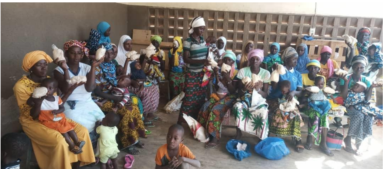
Bild: Die in Beuteln abgepackte Spezialnahrung wird an Mütter für ihre Kinder verteilt

Mit dieser Maßnahme kann aber nur den an mittelschwerer akuter Unterernährung leidenden Kindern geholfen werden. Für die akuten schweren Fälle ist die therapeutische Fertignahrung Plumpy nut erforderlich, eine Erdnusspaste, angereichert mit Öl, Milchpulver, Zucker und lebenswichtigen Vitaminen und Spurenelementen. Diese Nahrung ist sehr wirkungsvoll, aber teuer und nicht einfach auf dem Markt zu bekommen.