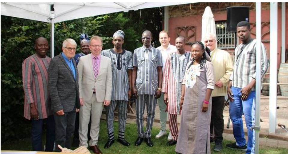
Bild: Die Delegation aus Silly beim Museumsfest

Oder, wie es der Botschafter formulierte: „Es lebe die Partnerschaft zwischen Viernheim und Silly! Es lebe die Freundschaft zwischen den Völkern!“