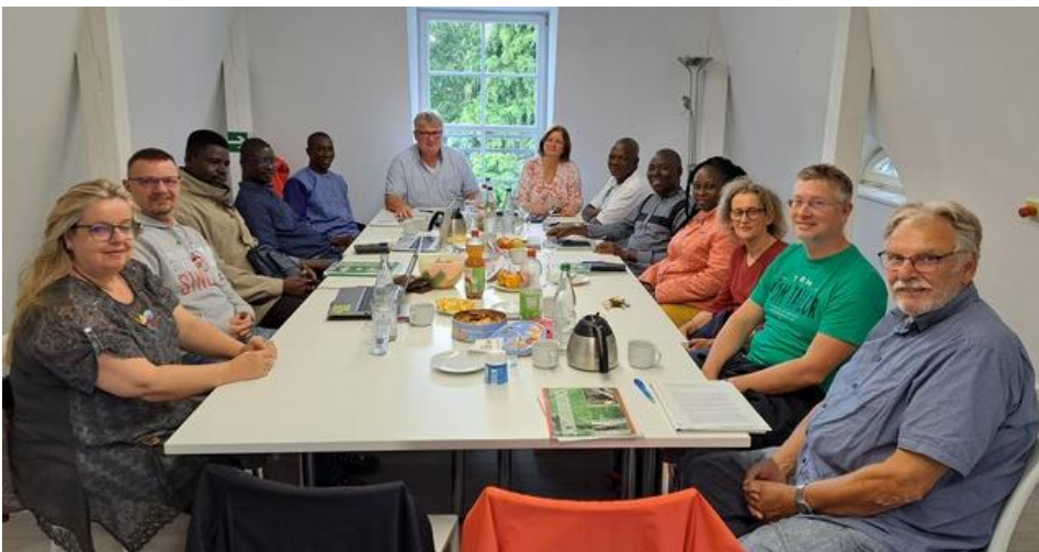
Bild: Besprechung der Delegation im Museum Viernheim