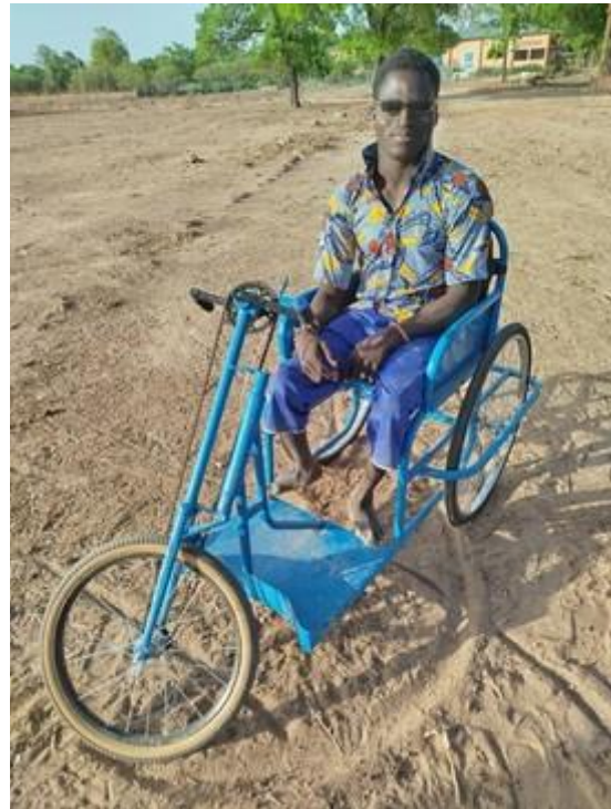
Bild: Junger Mann mit seinem Dreirad