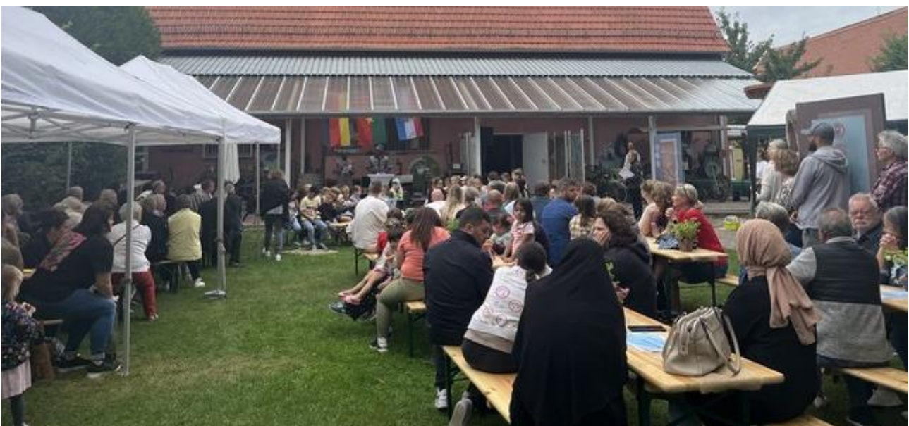
Bild: Das Museumsfest war gut besucht