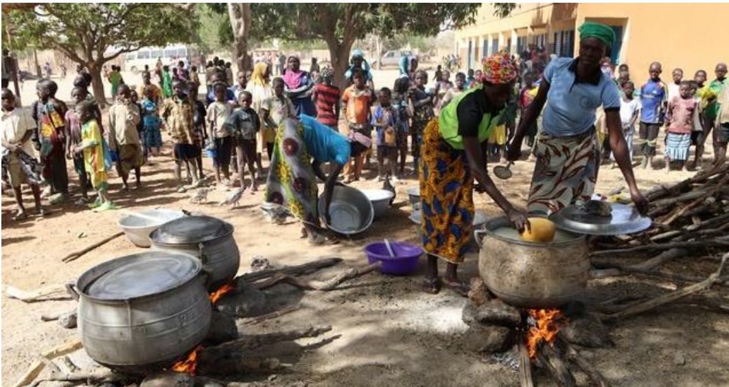
Schaubild 1: Bild: In der Mittagspause warten die Schüler sehnsüchtig auf die Ausgabe der Essensportionen.

deshalb nur geringe oder gar keine Lebensmittel für die Schulspeisung liefern. Die amerikanische Entwicklungsbehörde USAID hat bekanntermaßen ihre Hilfslieferungen auch eingestellt, was insbesondere bei den mangelernährten Kindern negative Auswirkungen hat.